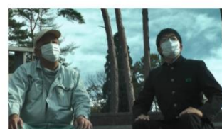
インタビュー（砥峰高原）

兵庫県教育委員会 義務教育課 HP、「兵庫五国連邦」HP で紹介される予定です。