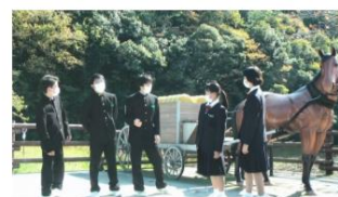
「銀の馬車道」の紹介